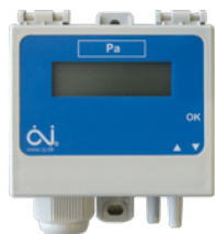
Bestelcode: 3004561 (230V) 3004560 (400V)